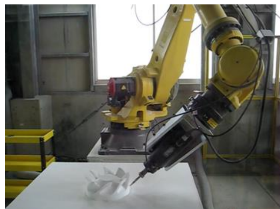
図2 実機ロボットによる加工実験風景