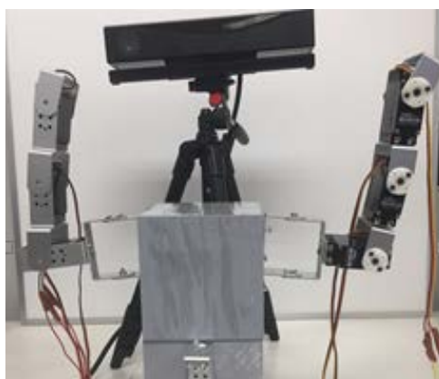
図 1 試作した実験システム

Kinect Camera で計測した人体の両腕部位の位置情報から関節角度を計算し、試作したシリアルリンクの隣り合うリンク間角度に変換できるようにした。今回製作したシステムは開発効率に優れた Visual Studio C#上で行ったため、Kinect SDK のハンドリングなど環境設定に時間を要したものの、比較的容易に操作者の身体を使った制御システムへの応用が可能であった。今回の研究で検討した自動制御技術は操作者の下肢あるいは身体全体の動きを入力(操作量)としたシステムへの応用が可能である。今後は医療やスポーツなどの現場で人間の複雑な動きを操作量として必要とする新しいシステムの開発への応用も大いに期待できる。